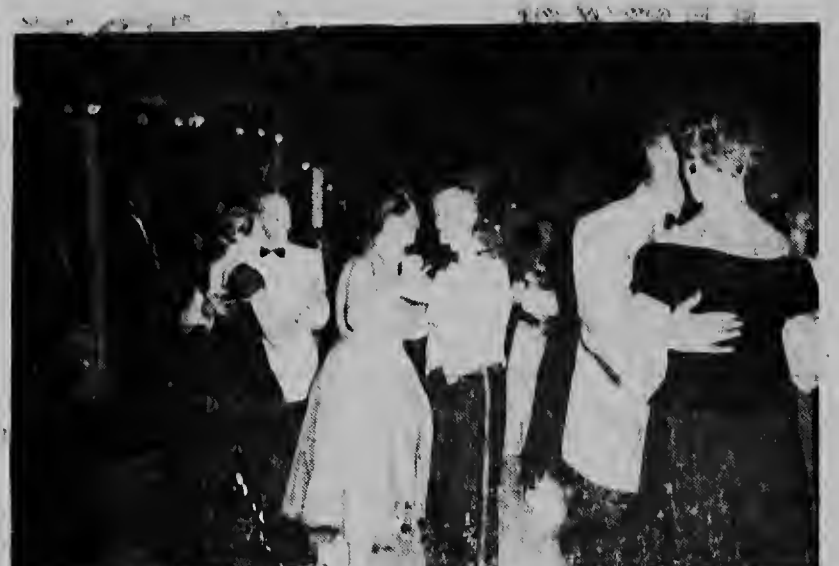
De stemming zat er al dadelijk in op het bal, dat commandant en officieren van de hier gelegerde mariniers Vrijdagavond aanboden ter gelegenheid van de 289e verjaardag van het Korps.

SAVANETA. — Op de hun bekende wijze hebben de mariniers Zaterdagavond feest gevierd in de kazerne te Savaneta. Het feest begon officieel om acht uur, doch het begon om negen uur pas goed te lopen.